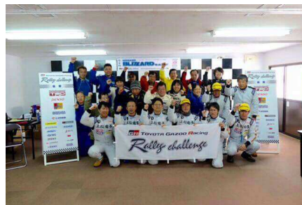
マシンから降りれば和気藹々。ドライバーの交流が盛んな TGR ラリー