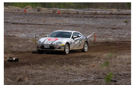
Rd3 木曾ラウンド。ギャラリーステージでは、一般の人も観戦できる新たな試みも